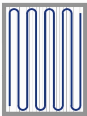
Fig. 1 - Korrekt utförd tvätt längs med brädorna.

Vid bruk av golvrengöringsmaskin: 2 banor med tvättvatten läggs ut i brädornas längdriktning och sugas sedan omedelbart upp eller efter maximalt 3 minuters verkan. Ta därefter bort vatten med en torr trasa. Var uppmärksam på vattenspill när maskinen roterar. Lämna aldrig kvar vatten på golvet. Det kan skada golvet samt försämra golvet's friktionsegenskaper vilket kan orsaka fallskador.